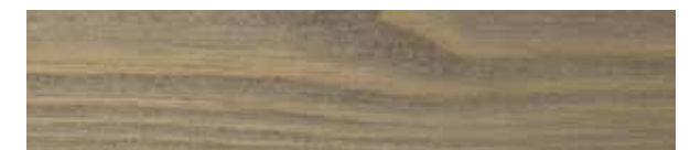
JOTUN PANELLAKK 90020 DEMPET LYSEBRUN