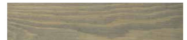
JOTUN PANELLAKK 90019 DEMPET LYS GRÅ