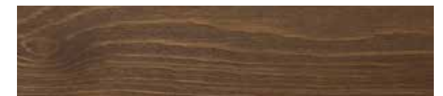
JOTUN PANELLAKK 90025 DYP NØTTEBRUN